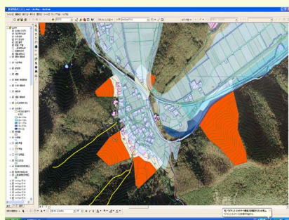
防災情報システムの画面例