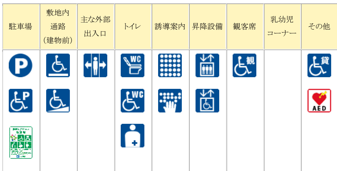
神戸商科キャンパスのユニバーサル施設情報

なお、神戸商科キャンパスのユニバーサル施設情報は下表のとおりであり、この情報は本研究科のホームページにも掲載している。