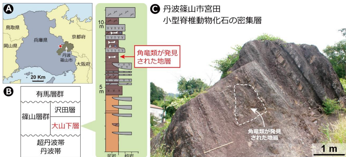
図1. 兵庫県丹波篠山市宮田の発掘現場。(A) 丹波篠山市宮田の位置、(B) 宮田の地質柱状図、(C) 宮田の化石発掘現場。点線で囲まれた場所で角竜類化石が発見された。

2007年の発見以降、ひとへく恐竜ラボでの化石クリーニング作業が進み、発見当時の3点に加え2023年までに14点の角竜類化石が確認されました。宮田からこれまで発見された角竜類の骨格化石17点を詳しく調べた結果、15点が頭骨で、1点が鳥口骨（肩の骨）、1点が脛骨（後ろ足の骨）であることが分かりました。多くの頭の骨はしっかり関節して組み上がることから、これらのほとんどは1個体分の角竜類に由来するものであると考えられますが、鼻の骨が重複していることから、少なくとも2個体以上の骨格が混合していることが分かります。