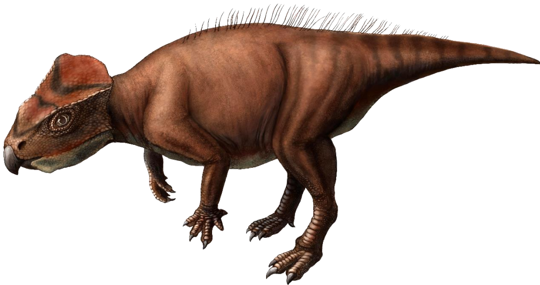
図3. ササヤマグノームスの復元画 (©田中花音). 推定全長は約 80cm.